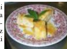
Sladki skutini štruklji

V V vaški krčmi vsak pozna vsakega. Sko-puha pobarajo, kaj je z njegovimi milijoni, ki jih hrani pod žimnico.